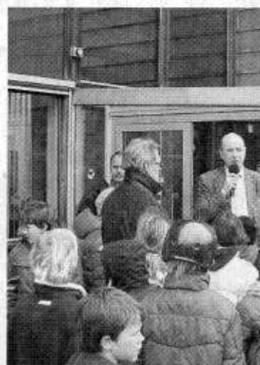
Met protesterende kinderen.